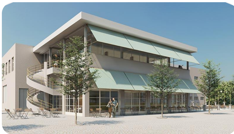
Vizualizace rekonstrukce divadla

Návrh knihovny pracuje s motivem bezpečného prostoru – pevnosti. S motivem společného prostoru, kde se lidé schází a objevují nové věci a získávají nová přátelství. Knihovna se tak stává nádherným místem pro načerpání energie a vědomostí. Kniha má moc člověka obohatit a dokáže obejmout a na hodnou chvíli nepustit. Objekt je jako kniha, dokáže člověka pohltit a vypráví mu příběh, vzniká v ní takový malý nový svět. Je to svět, ve kterém se skrývá spousta dalších neprobádaných světů.