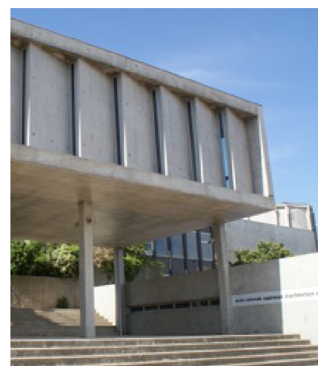
hlavní vchod do školy